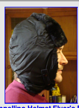
Cappellino Helmet Flyer's B9-B Vintage Made in USA